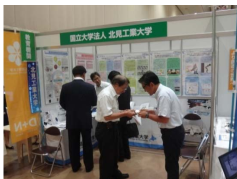
北見工業大学ブース

今回の展示を通じて、本学の長強について来場者に強くアピールすることができました。本フェアは研究の広報のみならず、大学の広報としても大きな成果を挙げる機会となりました。