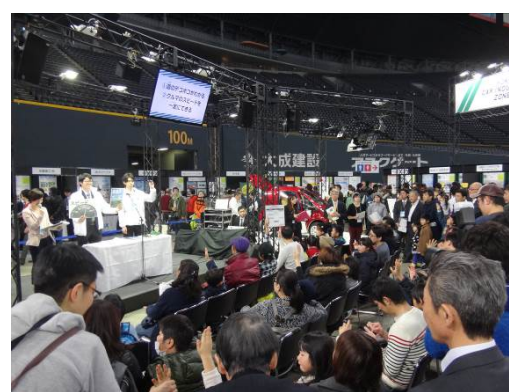
子ども向けクイズステージ