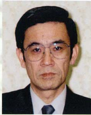
文部科学省研究振興局長